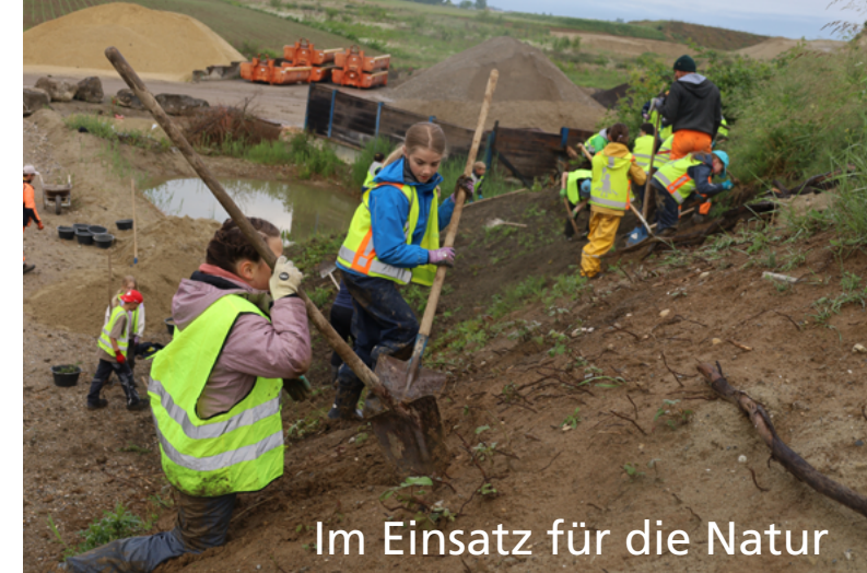
Im Einsatz für die Natur