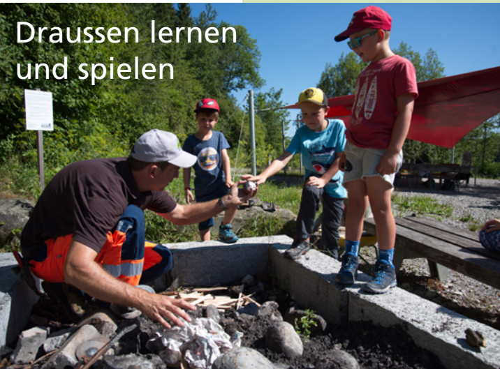
Draussen lernen und spielen