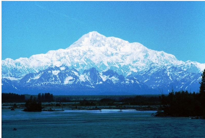
Alaska Mount McKinley